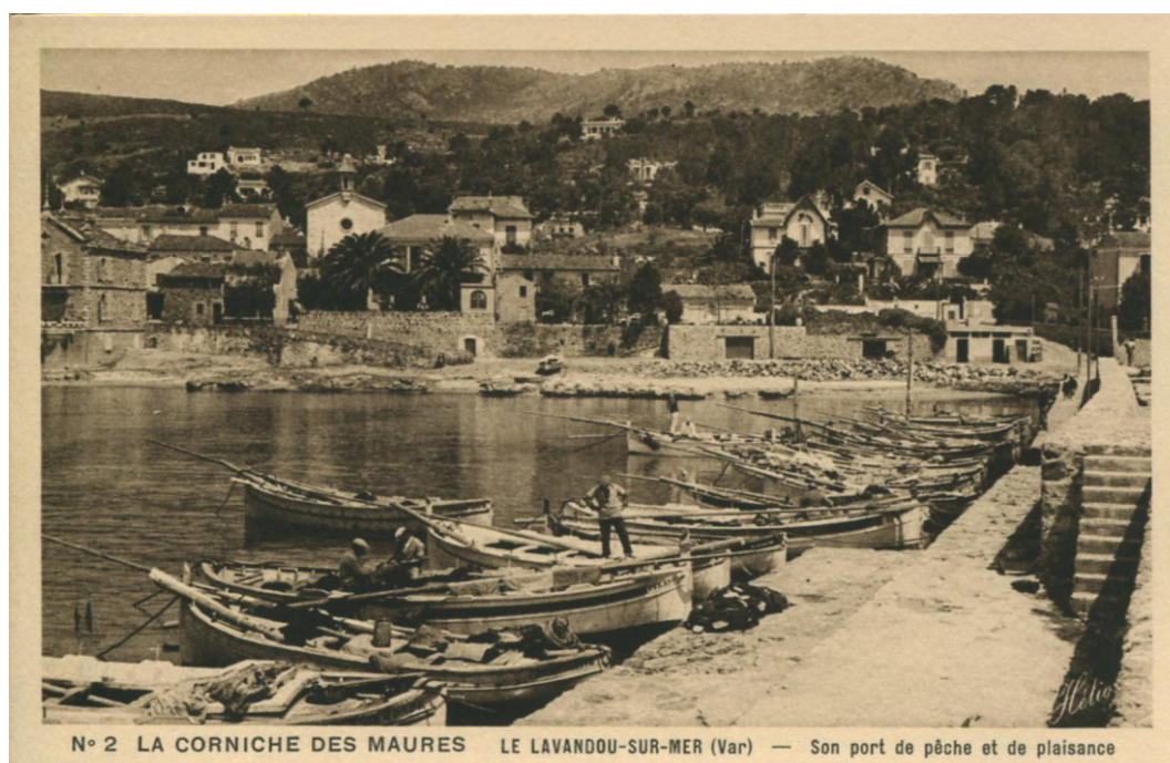
Figure 5. Port de pêche du Lavandou – Décennie 1950. Quai des pêcheurs de l'ancien port du Lavandou. La succession de dizaines de petits bâtiments, que l'on retrouve pour les mêmes époques dans tous les ports du littoral provençal, témoigne de l'importance des activités de pêche sur ce littoral après la Seconde Guerre mondiale.