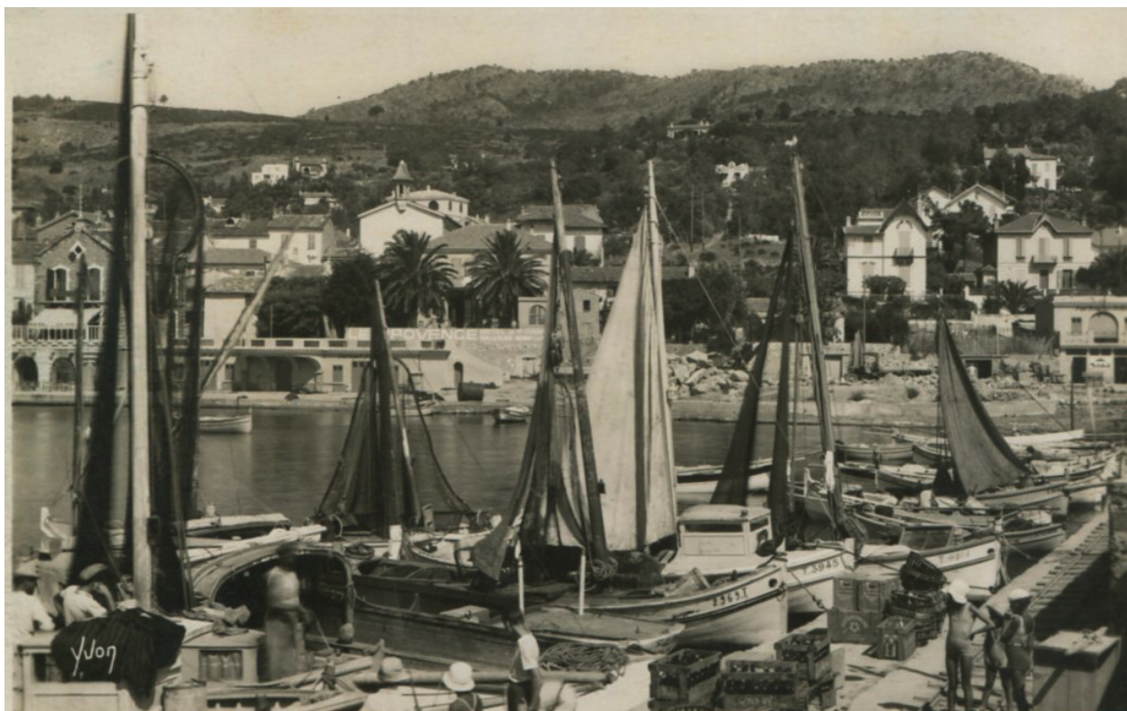
Figure 6. Port de pêche du Lavandou – Décennie 1960. Sur l'ancien quai des pêcheurs se succèdent bâtiments pratiquant la traîne et petites embarcations moins spécialisées, caractérisant la polyvalence des activités de pêche durant cette décennie.