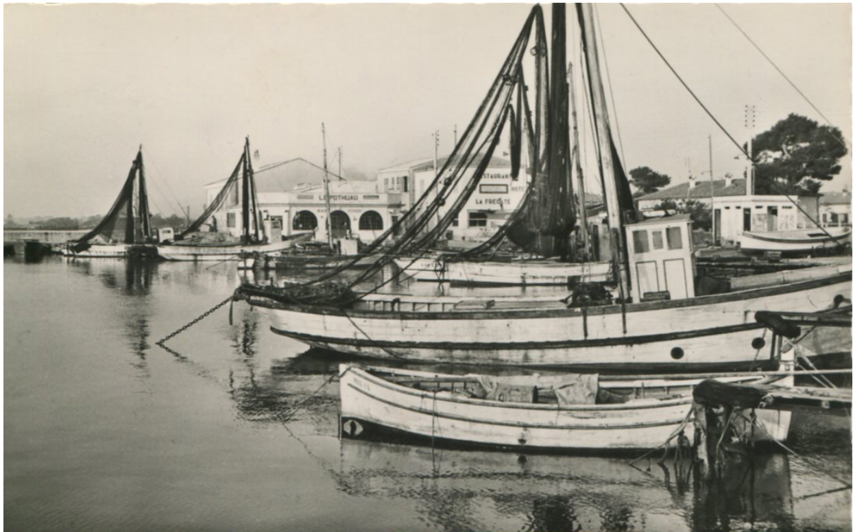
Figure 4. Flottille de pêche – Salins d’Hyères, décennie 1950. Spécialisée dans les arts traînants, la section des Salins (Prud’homie de Toulon) réunissait de nombreux patrons mettant en œuvre ce type de pêche. Ils étaient encore 42 pêcheurs à la pratiquer au début des années 1960, sur une centaine d’inscrits. Plus importantes que les bâtiments utilisés par les entremailleurs ou les palangriers, les unités stationnées le long du quai des pêcheurs sont équipées de leurs filet traînants prêts à être utilisés.